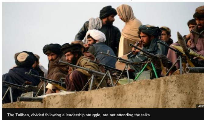
The Taliban, divided following a leadership struggle, are not attending the talks

درآورده اند. در ولایات جنوب هیلمند و قندهار قوای امنیتی دولت از تمام ولسوالی ها، رانده شده اند. در ولایات