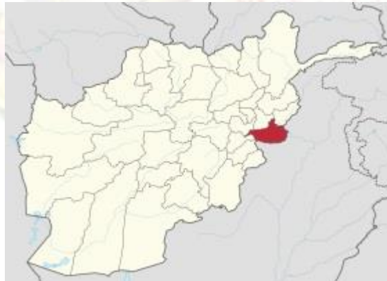
ولایت ننگرهار به رنگ سرخ نشانی شده است

کنفرانس کشور های کمک کننده به روز سه شنبه ۴ اکتوبر ۲۰۱۶ در بروکسل پایتخت بلجیم گرد آمدند و برای دو روز در باره چگونگی دوام کمک به افغانستان مذاکره نمودند. افغانستان به طور بی سابقه در برابر یک نوع تمرد و سرکشی و صعود فساد اداری و ارتشا و عدم ثبات و امنیت قرار دارد، عواملی که اقتصادش را به سوی تباهی می برد. چیزی که در پهلوی دگر نارسایی ها بیانگر این حقیقت است، اخذ تکس غیر قانونی از صدور سنگ تلک توسط داعش و طالبان می باشد. پودر تلک در یورپ به نام (پودر سفید) مشهور است و در اروپا و همه جاهای جهان خریدار زیاد دارد.