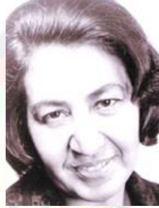
شهيډ ميرمن بلقيس نادر آصفی خاشنه رئيس جمهور