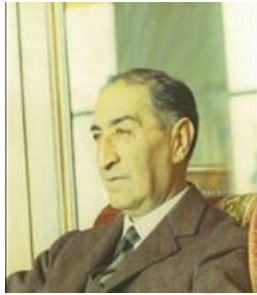
شهيډ سردار محمد نعيم برادر رئيس جمهور