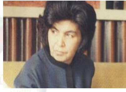
شهيډ ميرمن عايشه عزيز خواهر رئيس جمهور