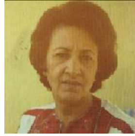
شهید سردار محمد داؤد خان شهید بی بی زینب نادر داؤد