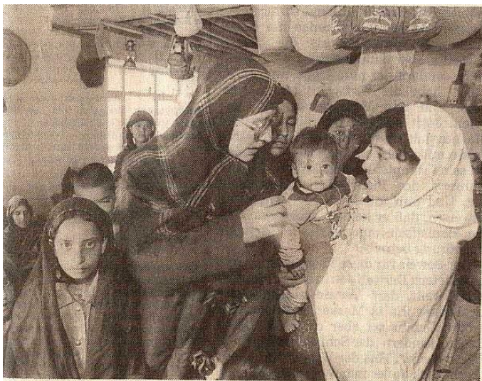
VIEL schlechter dran als die Menschen in Bosnien: Die afghanische uis Katil versorgt mit Unicef-Mitteln kranke Kinder in Kabul.

در یک «رپور» مفصل خبرنگار «زویید دویچه سائیتونگ»، منتشر شده مؤرخ ۱۸ مارچ ۱۹۹۴م، می خوانیم که