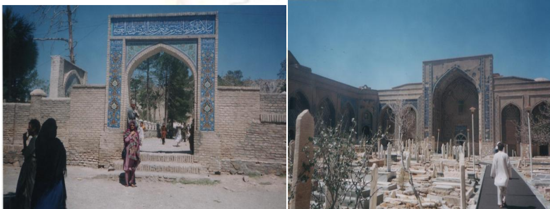
آرامگاه خواجه عبدالله انصاری

از جمله نوابغ و علمای مشهور هرات، عصر سلجوقیان بوده که در طوس در سال 1006 میلادی یا قرن یازدهم میلادی متولد و در سنه 1089 میلادی از این جهان فانی رحلت نمود. وی از جمله بزرگترین عالمان فقه (Théologien)، بزرگترین شاعر، ادیب، صوفی و عارف و دانا بود و در علم تصوف به بلندترین مقام رسید، که مناجات های او بسیار مشهور می باشند، مولانا به لقب شیخ الاسلام مشرف گردیده بود. مزار خواجه عبدالله انصاری پیر هرات، عارف برجسته و شاعر نامدار در شمال شهر هرات واقع است.