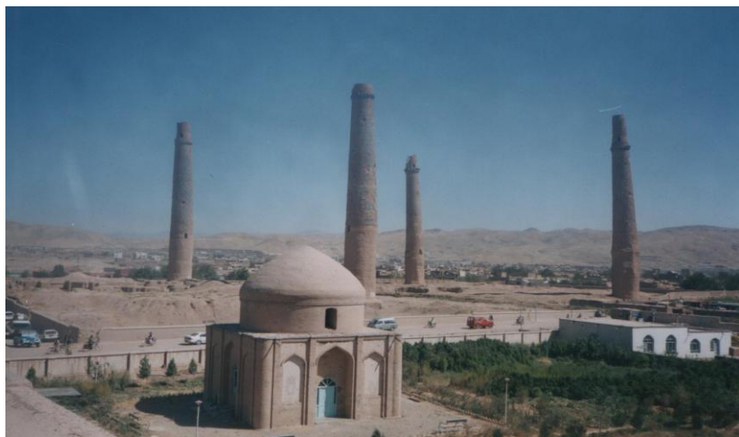
منار ها و آرامگاه ملکه گوهرشاد

آثار تاریخی هرات: بالاحصار یا قلعه یا ارگ هرات، منار های هرات، مسجد جامع هرات، آرامگاه خواجه عبدالله انصاری و آرامگاه ملکه گوهر شاد خانم ادیب و دانشمند، همسر شاه رخ میرزا، که در عصر با شکوه تیموریان در قرن پانزدهم میلادی (1469-1506) می زیست. از شعرا، ادیبان و رسامان این دوره میتوان از شاعر و عارف جامی، امیر علی شیر نواعی و رسام بزرگ میناتوری بهزاد نام برد.