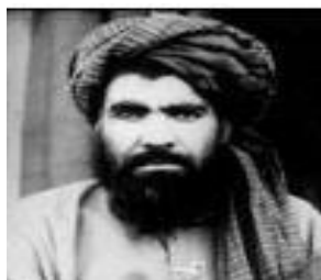
ملا نورالدین ترابی

بعد از مداخله قوای ائتلاف، وی در پاکستان در زندان، و تحت کنترل پاکستان بود در سال 2012 میلادی پاکستان برای خوب شدن روابط بین دو مملکت رهایی هشت زندان طالب را قبول نمود، که در بین آن ها ملا ترابی و ملا عبدالغنی برادر، ملا جهانگیروال (منشی سابق ملا محمد عمر) و ملا الله داد طیب شامل بودند.