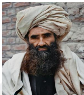
جلال الدین حقانی

جلال الدین حقانی و حزب وی مسولیت خیلی زیاد و جدی در تخطی و نقض حقوق بشر دارند، که شامل اختطاف ها، حملات انتحاری بالای مردم ملکی و به قتل رساندن کارکنان کمک های بشری می باشند.