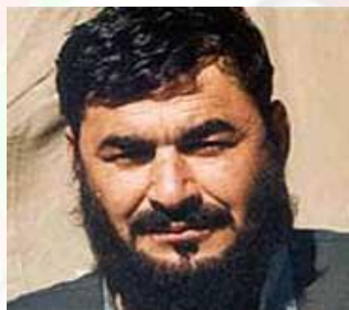
حاجی بشیر نورزی

حاجی بشیر نورزی مشهور به پادشاه مواد مخدر بود و با طالبان و القاعده روابط داشت. اصیل ولسوالی میوند ولایت قندهار و خزانه دار طالبان و از نزدیکان ملا محمد عمر آخند بود. در سال 2001 میلادی توسط قوای امریکایی دستگیر و به صورت عجیب و اسرار آمیز دوباره رها گردید. در پاکستان تحت حمایت آی . اس . آی (ISI) زندگی می نمود اما در سال 2004 میلادی دولت امریکا نامش را در لست اشخاصی که در قاچاق مواد مخدر دست دارند، درج نمود. چون می دانست که دوباره دستگیر می شود، قبول نمود که با اف . بی . آی (FBI) معامله نماید، وی با امریکایی ها در یک هتل در امارات عربی وعده داشت و نظر به عدم حضور امریکایی ها، نورزی به پاکستان برگشت و از چنگ امریکایی ها نجات یافت. در بهار 2005 میلادی امریکایی ها دوباره با وی تماس گرفتند و از وی دعوت آمدن به امریکا را نمودند، که با تعجب زیاد امریکایی ها، نورزی دعوت شان را قبول نموده به امریکا سفر کرد. اداره بوش (administration Bush) در حقیقت حیران شد که با وی چه کند، بالاخره در تابستان 2005 میلادی وی را در زندان گونتنامو زندانی نمودند.