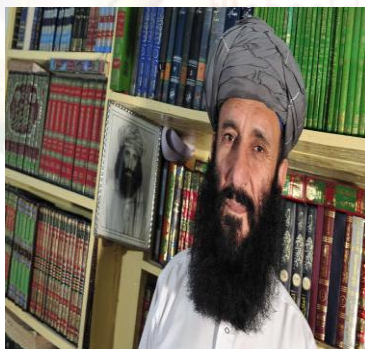
ملا محمد قلم الدین

سال تولد وی 1953 میلادی می باشد. وزیر امر به معروف و نهی از منکر و وزیر عدلیه از سال 1997 الی 2001 میلادی بود، بعد از آن طالبان را ترک کرد.