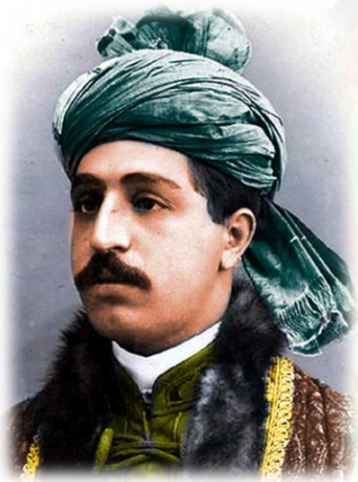
د میوند فاتح، سردار محمد ایوب

که د بناغلي سيستاني حکم رښتیا وای، برتانوي هند به ولي د افغانستان د لاندي کولو لپاره د جنرال رابرتس په قوماندانی يرغل کاوه؟ حقيقت دادی چي افغانستان د افغان-انگليس تر دوهم جنگ پوري د بناغلي سيستاني د حکم پر خلاف " ... یک کشور تحت الحمایه و زیر نفوذ سياسي انگليس" نه وو، او امير شير علي هم دغسي واکمن نه وو چي د افغانستان باندنی سياست دوی ته وسپاري او د دوی يو انگليس الاصله سياسي استازی په کابل کې ومني، نتیجه جنگ او د کابل اشغال، او په مزار کې د امير وفات شو، خو په کابل کې د برتانوي هند سياسي استازي، کوه نیاري (Cavagnari) له خپلو چارواکو سره په یوه ملي پاڅون کې ووژل شو، او کابل بیا اشغال شو. وروسته د دوی پوځ د کندهار په میوند کې د غازي محمد