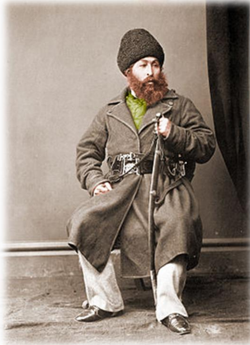
امير شير علي خان

امير لا په كال ۱۸۹۶ كې چې د برتانوي هند حكومت چترال ونيوه، په داسې حال كې چې روسانو په كال ۱۸۹۲ كې له پنجده نه پرته د بدخشان علاقه له افغانستان نه په زور نيولې وه، افغانستان ته خطر حس كړ، او په فرمانونو كې يې خپل ولس په دې ډول مخاطب كړ، چې "او خلكو، هغو چې په افغانستان باندي دوه ځلي يرغل كړئ، غواړي درېيم ځل يې هم وكړي"، خو د هند حكومت په دې اړه ځان پوه نه كړ. لكه چې په دې اړه يې ځان ناگاره اچولئ وو، چې امير د خپلي واكمنۍ په اخيرو كلونو كې چې حكومت يې ټينگ او پوځ يې پياوړئ وو، ځان حتى د هند حكومت ته په رسمي ليكونو كې هم د خپلواك افغانستان او د هغه د مضافاتو واكمن بڼوده.