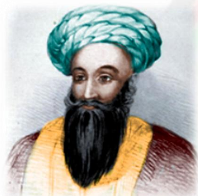
شاه شجاع درانی

ښاغلي سيستاني په تاريخپوه ياديري، او دا خو د يوه تاريخپوه دنده ده چې ليکني يې په واقعيتونو او د ثقه شواهدو پر بنسټ وي، خو د ده ليکني کاشکي دغسي واي. دغې ليکني ته يې ځير شئ، چې په افغان-جرمن ويب سايت کې يې د ۲۰۱۴ کال د دسمبر په ۱۳ مه کړې ده، او ويلي وو چې افغانستان " ... از زمان شاه شجاع تا امير حبيب الله خان (۱۸۰۹-۱۹۱۹) در سياست خارجي خود مستقل نبوده است، و بدون اجازه انگليس نمیتوانست با هيچ کشور ديگر روابط ديپلوماتيک داشته باشد. به کلام ديگر افغانستان يک کشور تحت حمايه و زير نفوذ سياسي انگليس بوده است."