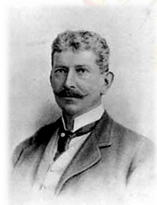
ليپل هنري گريفن د برتانوي هند سياسي استازي (Lepel Henry Griffin)

شي. په کال ۱۸۸۵ کې چې امير په رسمي دعوت هند ته تللی وو، هلته وايسرائ وړځيني وغوښتل چې که دی د افغانستان په داخلي چارو کې هم د ده مشوره ومني. امير ورته رد وويل، چې زما رعيت په داخلي چارو کې ستا مشوره نه مني، او زه دغه کار کولی نه شم، او زه يوازې په باندنيو اړيکو کې ستا مشوره منم. بل مثال د امير د داخلي خپلواکۍ په اړه د کونړ د سيد محمود پاچا په اړه دی، چې هغه د جنگ په وخت کې د غازيانو پر ضد د برتانويانو خوا نيولي وه. په جلال اباد کې يې د برتانوي هند حکومت له سياسي استازي، ليپل گريفن (Lepel Henry Griffin) سره په کتنه کې ورته