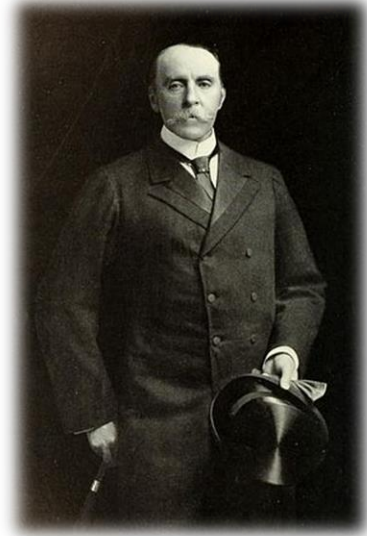
مار تيمور ديورنډ (Mortimer Durand)

بي د خبر لوڅی وه، او هغه په دربار کې هغسي حيثيت لاره لکه وکيل چې د امير دوست محمد په وخت کې لاره. پر ده باندي امير قيود هم ايښي وو. ده امير ته هم رپوتونه تهيه کول او خپله پوسته يې هم د امير پوسته رسوونکو په وسيله ورله، او راورله، او په دربار کې يې هم يو محقر ځای درلود، چې حتی مارتمر ديورنډ، چې په کال ۱۸۹۳ کې هغه په دربار کې په دغه حال وليد، خپل حکومت ته يې د هغه په هکله شکايت وکړ.