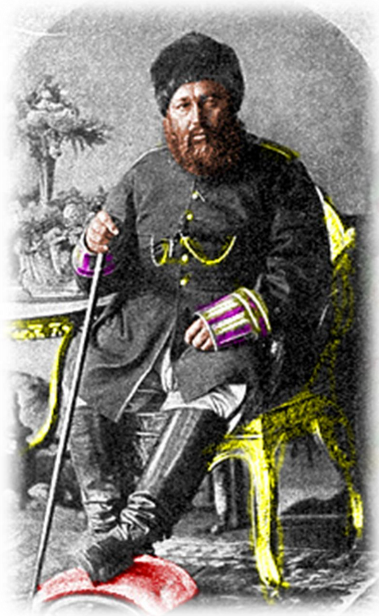
امير عبدالرحمن خان

عوايدو نه برسېره ودانيو، دفترونو او ميرزايانو ته ضرورت لري. په داسي حال كې چې ځينو قومونو حكومت ته ماليات نه وركول، او نورو چې د جمع بست په نامه وركول، ډېر لږ وو، چې هغه هم د هغو ملكانو له لارې حكومت ته رسېدل. دا امير عبدالرحمن وو، چې له درانيو نه پرته، د نورو قومونو په بنسټيزو مخكو باندې يې د سه كوت سيستم جاري كړ، چې د هغه له مخې دمخو درېيمه برخه حاصلات حكومت ته تخصيص شول. په دې اړه ډېر پاڅونونه وشول، او حكومت په خپل پوځ هغه ټول وځپل. تر هغه دمخه د افغانستان نظامي قوت له منظم پوځ (سپاه منظم) نه په غير منظم پوځ (سپاه غير منظم) ډېر متكي وو.