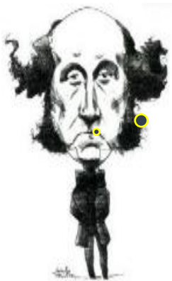
جان سټيورت مل