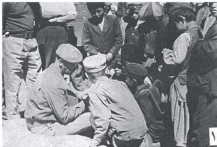
اعلیحضرت محمدظاهر شاه در بین متعلمین مکتب ابتدایی