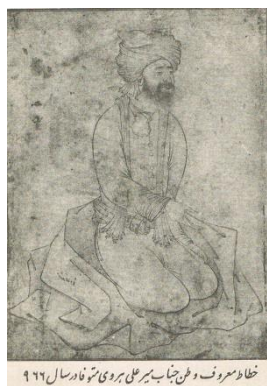
خطاط معروف و فن‌نایاب بر علی هروی نامدار سال ۹۶۶