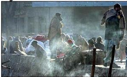
Afghanistan urgently needs international aid

در قسمت بالایی تصویر سمت چپ نشان می دهد که، که به تاریخ ۲۳ جنوری ۲۰۰۲م، "رهبر افغانستان وارد چین شده است." در پایان تصویر می خوانیم: "افغانستان به کمک عاجل بین المللی ضرورت دارد."