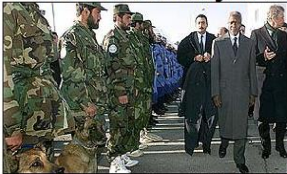
Annan is the first secretary general in Kabul for 40 years

می گذارد، الی ختم دوره ریاست جمهوری "بوش"، تمام "وقایع" را بدون "تشویش" و نا آرامی، "حل و فصل" می نموده است، که در قسمت های بعدی جای که لازم و ممکن باشد، معلومات جمع آوری می گردد.