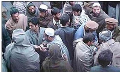
Money market: Prime target for crime

Friday, 11 January, 2002, 12:15 GMT Kabul crime wave fears