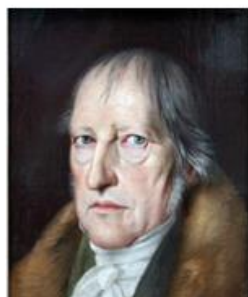
Georg Wilhelm Friedrich Hegel, porträt von Jakob Schlesinger, 1831

اگر در ذهن بعضی جای گرفته باشد، از دید این نویسنده نا درست بنظر می رسد. فلسفه و فیلسوف می خواهد در باره حقیقت زندگی انسان معلومات حاصل کند و هم چنان تا حد ممکن راز های این جهان ما را، درک کند. فیلسوفان هم همیشه قادر نخواهند بود، تا در هر لحظه و در هر مرحله، طبق ضرورت و رضایت هر کس، جوابی داشته باشند. فیلسوف می تواند، هم "مذهبی" باشد و هم "غیر مذهبی". بحث مفصل درین جا، نمی گنجد. تهیه لیست و سوانح فیلسوفان معروف تمام کشور های اروپائی، هدف این مقاله نبوده است، البته کار و فرصت می خواهد. اما آنچه فاقد مفیدیت نخواهد بود اینست، که اقلأ با نام های تعدادی از متفکرین اروپا، بخصوص آنهایی که با افکار روشنگری خود، در حقیقت جهان را بسوی تمدن جدید، رهنمائی کرده اند. درینجا، نمونه وار یادآور شده ایم. کشور آلمان در صف کشور های پیشرو، یاد شده است. درینجا، ازین سه فیلسوف برجسته آلمانی نظیر، "کانت"، "فیخته" و "هیگل" یادآور می شویم، که از بزرگترین متفکرین در تاریخ یاد شده اند، و هریک از آنها، دستاورد های خاصی خود را، به تاریخ سپرده اند. این سه فیلسوف در دوره های آغاز "روشنگری" و تجدد، در اروپا، سهم ارزنده و در مسیر آینده انکشاف این جوامع، نقش بزرگ و سمت دهنده داشته اند، که تا امروز از افکار آنها، استفاده می شود.