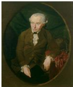
Immanuel Kant (Gemälde von Gottlieb Döbner, Zweite Ausführung für Johann Gottfried Kiseewetter, 1791)

مطالعه بعضی از متون نوشته های هم وطنان ما، برای این نویسنده انتباه حاصل شده است، که گویا "فلسفه" تلاش دارد، جای "دین و مذهب" را بگیرد و بهمین ترتیب، گویا "فیلسوفان" با "پیغمبران" در رقابت باشند. چنین تصور