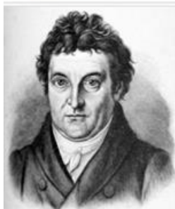
Johann Gottlieb Fichte