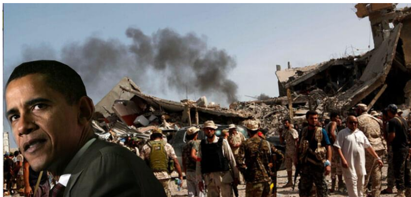
اوباما و تحفه اش برای مردم لیبیا

بالاخص شرق میانه، چشمان زعامت کشور های متجاوز را کور ساخته است. تجاوز کشور های پیمان ناتو به لیبیا همراه با گروه اسلامی مخالف قذافی، فضای نشو و نما و گسترش تروریسم را نه تنها در لیبیا بلکه در سایر کشور های شرق میانه آماده ساخت. سوریه اولین کشوری بود که به این مصیبت مواجه شد. بیش از ۳۰۰۰ تن جنگجویان تربیه شده در لیبیا روانه سوریه شدند تا آتش جنگ و بی ثباتی را در این کشور بیافروزند که بعداً درین مورد صحبت خواهیم کرد.