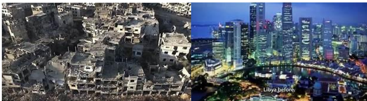
قبل از جنگ