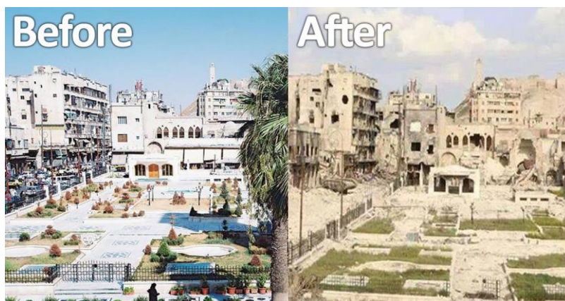
آرزومندی امپریالیسم: یک شهر زیبای لیبیا قبل از جنگ و بعد از جنگ