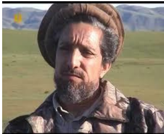
چهره یک تبهکار و ضد میهن

پهلوان احمد جان از فرار مسعود و حکمتیار به پاکستان و فعالیت های ضد افغانستان این دو تن به شدت انتقاد میکرد و آنها را نکوهش می نمود و خاین به میهن خطاب میکرد. بعد از تجاوز شوروی و نصب یک دولت دست نشانده در کابل، پهلوان احمد جان با شجاعت زایدالوصفی جبهه مقاومت پنجشیر را به راه انداخت و به مبارزات ضد استعماری و ضد سوسیال امپریالیستی آغاز نمود. او شخصیت والای انسانی داشت و معتقد بود که "پروردگار موهبتی به انسان ارزانی داشته که اعتماد به نفس است". زمانیکه جنبش میهنی ضد تجاوزگران شوروی و عمال آنها به رهبری خردمندانه پهلوان احمد جان در پنجشیر اوج میگرفت، احمد شاه مسعود هنوز هم در پاکستان بود و از آی اس آی فرمان می برد.