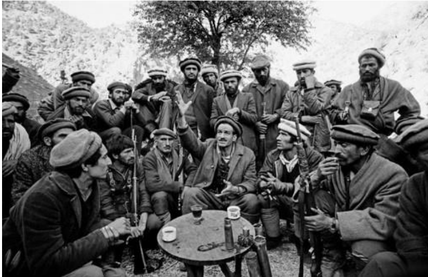
درین تصویر، پهلوان احمد جان دستور میدهد و احمد شاه مسعود فرمان میبرد

سمتی نفرت داشت. مردم پنج‌شیر و مبارزان راه آزادی این بخشی از وطن، پهلوان احمد جان را نماد مقاومت میهنی علیه متجاوزین شوروی و عمال مسکو می دانستند. موجودیت همچو شخصیت برجسته می توانست مسیر سیاسی و اجتماعی کشور را به نحو مثبت تغییر دهد و از برپادی های تحمیلی احمد شاه مسعود بر خاک و میهن ما جلوگیری نماید.