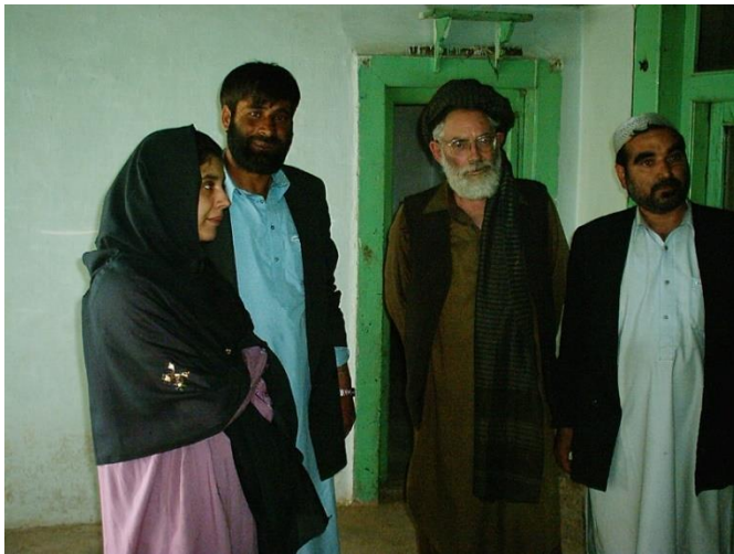
جست و جو و انتخاب محل مرکز تعلیمی در غزنی

و روزانه در حدود زیادت از ۶۰ خانم را پذیرا می باشد. آنهای که از نعمت تعلیم بهره مند اند، در این مرکز به یاد گرفتن انگلیسی و انفارماتیک و خانم های که سواد ندارند