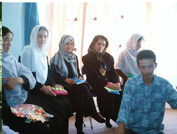
صنف اول تدریس زبان انگلیسی

یک کودکان نیز برای اینکه خانم ها اطفال خورد سال شان را که در منزل برای نگهداری آنها امکانات ندارند، پیش بینی گردیده است تا بتوانند به فکر آرام به آموختن بپردازند و همچنان مسؤولیت این کودکان به شخصی که قابلیت تربیه طفل را دارد سپرده تا بتواند به صورت درست از اطفال نظر به ضرورت شان رسیدگی نماید.