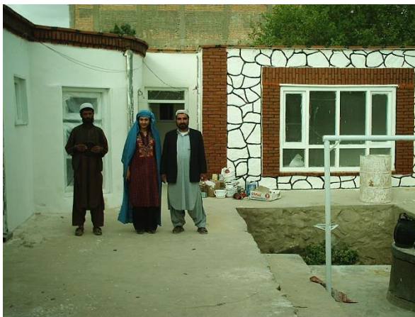
پیشرفت امور ساختمانی مرکز تعلیمی غزنی

کورس های سواد آموزی، و قرار انتخاب خود شان کورس های گل دوزی، زراعت و مالداري، تولید سبزیجات و قوریه جات و برخی هم به کمک های اولیه صحی مشغول آموزش اند.