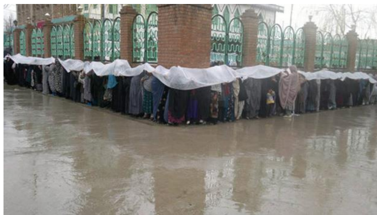
منظره ای فراموش ناشدنی از اشتراک زنان در انتخابات سال ۲۰۱۴ که اشک به چشم می آورد

می بینیم که تفکر آزاد راه حل بسیاری از مشکلات زن افغان امروز است که ودیعه تصمیم گیری و مؤثریت مثبت را در محیط فامیل و اجتماع میسر میگرداند و به طبقه اناث محروم افغان جوهر شخصیت و اعتماد به نفس اعطاء می نماید. بر زنان مملکت ماست که از حقوق مشروع مطرح بودن و قدرتمندی و توانایی خود ها در کوره راه حیات شان استقبال نموده و به اراده محکم خود باور و اعتماد داشته باشند. و من الله توفیق!