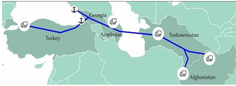
۲، نقشه : د لاجوردو دلاری مسیر له افغانستان څخه تر ترکی (اروپا) پورې

اقتصادي ده . که وغوارو دقزاقستان له لاري خپل مالونه وليرو، نو لار ۶۲۰۰ کيلومتره ده او پر يوه لاري ۴۲۰۰ او يا ۴۵۰۰ ډالر مصرف راځي، خو که دتور غونډی نه يوه لاري بار کړو ترکي ته پي يوسو او بيا پي اروپا ته ورسو لار