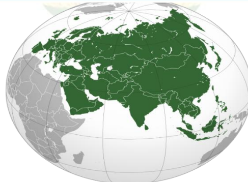
۳، نقشه: د اېرو ایشیا منطوقی اقتصاد

به پوره کړي. له دې لارې به حق العبور او مالیه تر لاسه کړي، ملي عواید به لوړ شي، د پردیو له احتیاجه به بیغمه شو، کار او شغل به ایجاد شي. په سیمه کې به د افغانستان ارزښت لوړ شي (او لوړ هم دی). جگړه به ختمه شي، ثبات به ورسره وغوړېږي او اوسنی ټولې ستونزې به ورسره حل شي. که دغه پلان عملي شي افغانستان به دایران پر چا بهار سربېره په سیمه کې د اوبو نورو نویو بندرونو ته لار ومومي. د آسیایي هیوادو د اقتصادپوهانو له طرحو سره سم، افغانستان په دې منطقه کې هم د چاه بهار د راتلونکی دورنما، د یوې لارې یو کمربند او هم د ورینمو لارې راتلونکي له مخې اساسی ارزښت لري.