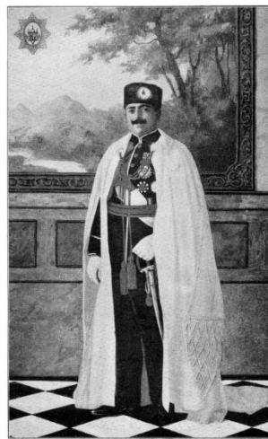
اعلیحضرت امان الله خان پادشاه معظم افغانستان پادشاه تشریف فرما بآلمان (نوروز ۱۳۲۸ هجری قمری)

اگر از یکطرف وضع طبیعی و اجتماعی ملکت و ملت افغانستان را که در ناف آسیا و در حلقه واقع شده که باد سببا بیز نسیم جان بختی ترقیات فرنگستان را پادشاه نمیتواند برساند و از طرف دیگر اقدامات بزرگ اساسی و تجلیات روشن و